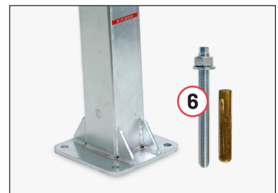
Verbundanker (8 Stück), im Lieferumfang enthalten / Ground anchor (8 pcs), included in delivery

Complete beach volleyball net system with Pro Beach net posts with ground sockets for foundations. The net system is fixed on foundations for permanent use.